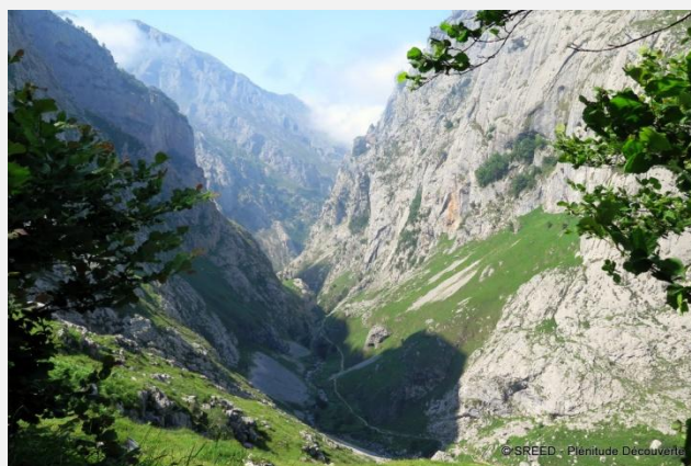
L'une des nombreuses vallées