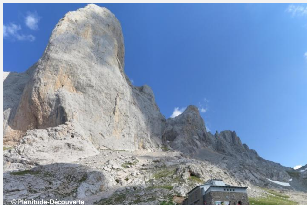
Pic Naranjo De Bulnes