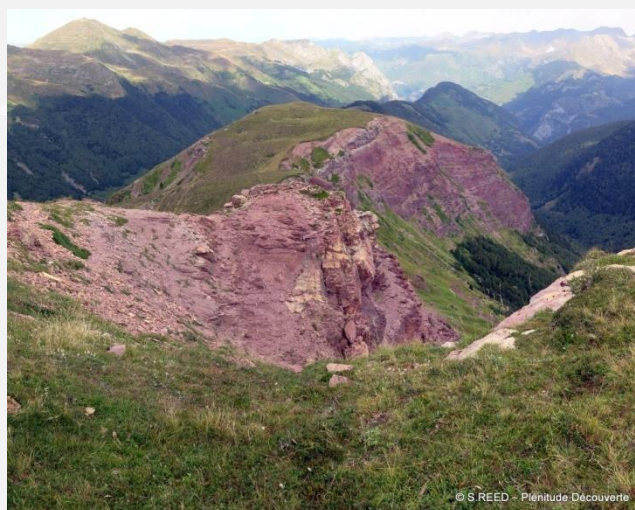
Vers le pic d'Arailly