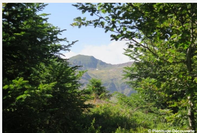
Vers le vallon de Belonce