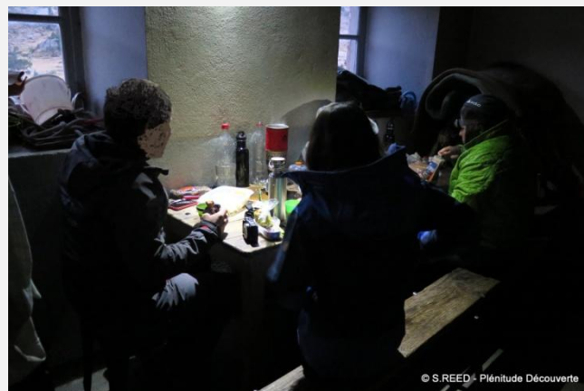
Bivouac en autonomie, en cabane, en refuge non gardé ou sous abris de neige (igloo)